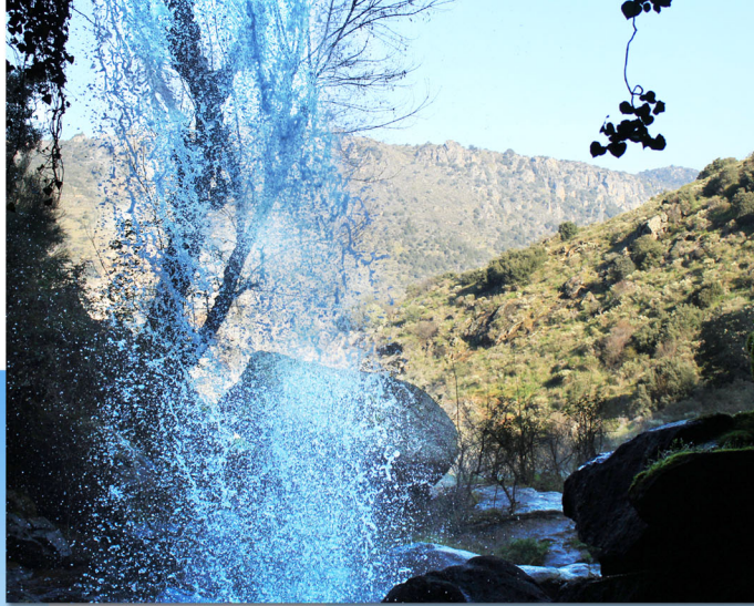
El Pozo Airón Vista desde el interior de la cascada

Las construcciones -como todas las de la zona- están realizadas en mampuesto de granito asentado sobre mortero de barro, generalmente reforzadas con sillares en aristas y vanos. Mampuesto de granito que se repite en los bancales o paredones para aprovechar el cultivo, en los chozos o casitas que sirven de refugio en el campo y en las paredes que delimitan las fincas, formando en conjunto una cultura ancestral en el uso de la piedra.