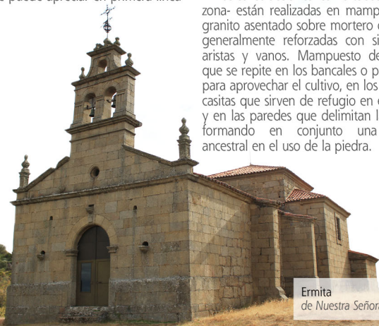
Ermita de Nuestra Señora del Castillo